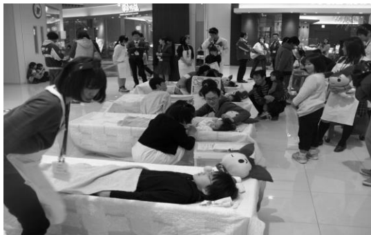
(上記写真)献血模擬体験をする子どもたち

前回の会報で、今三重県では10～20代の献血者数が減少しており、献血率が全国最下位であるという現状と、若い献血者を増やすべく様々な活動を行っていることをお伝えしました。今回は、昨年度に開催したイベントを紹介します。