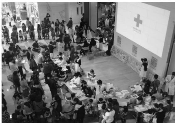
(上記写真)大盛況となった初開催のイベント風景

もちろん、必要な血液を確保するために献血バスと下記の献血ルームでの献血の受け入れも行ってまいりますので、特に400mL全血献血及び血小板成分献血へのご協力をよろしくお願いいたします！